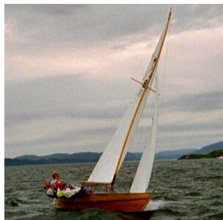
"Ola Dilt" i fullt driv under KM

Lørdag skiftet vindretningen ganske mye under seilasene, fra NV til SØ, samtidig som vinden varierte i styrke uten noen gang å bli særlig sterk. Med tålmodighet både fra arrangør og seilere fikk man avviklet seilasene etter mange timer på sjøen. Den første seilasen ble vunnet av K 3 "Sjansje", mens K 7 "Glimt" vant den andre. Etter første dag ledet "Sjansje" sammenlagt foran "Rosita" og "Glimt".