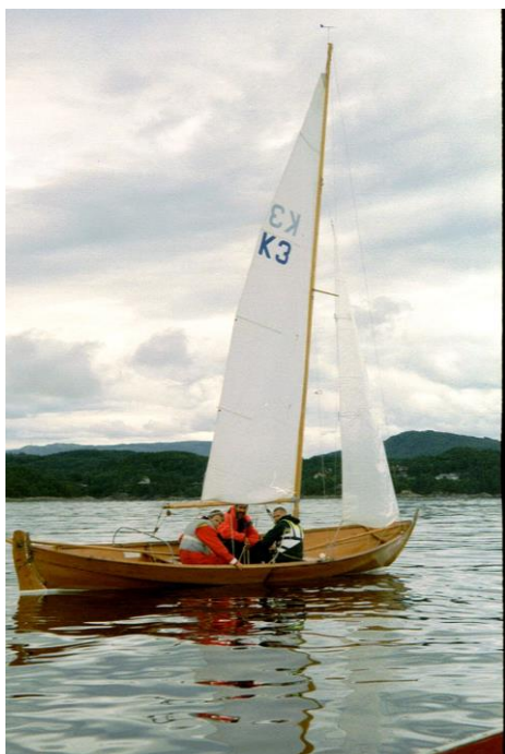
K 3 "Sjanse" Kretsmester 2000

K 7 "Glimt" tok 2. plassen med 11.0 poeng, mens K 54 "Margrethe" kom på 3. plass med 11.4 poeng.