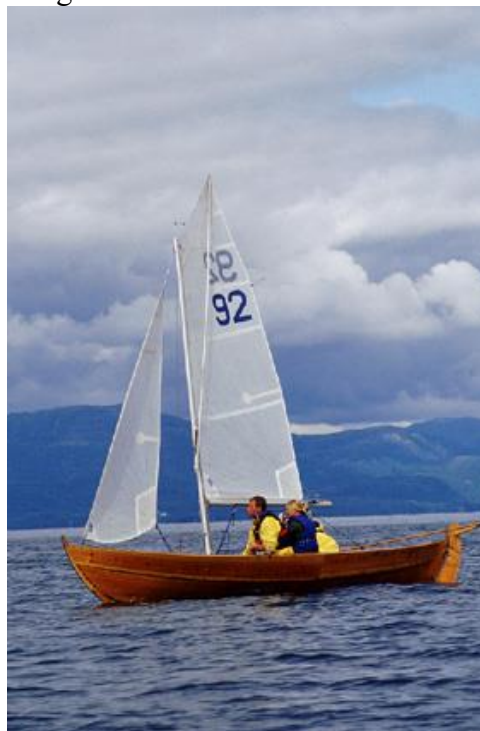
"Losen" Norgesmester 2001

"Margrethe", "Glimt" og "Cathrine" fulgte på de neste plassene innenfor NMs 10 premierte plasseringer.