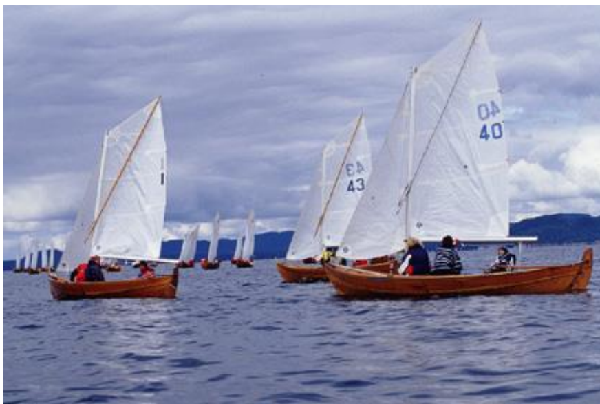
1 "Bambi" tar starten på 3.0 sek i 4. seilas under NM

DNC = Deltok ikke DNF = Fullførte ikke DSQ = Diskvalifisert OCS = På løpssiden av startlinjen da startsignalet ble gitt. Vendte ikke tilbake for å starte riktig. RDG = Godtgjørelse innvilget