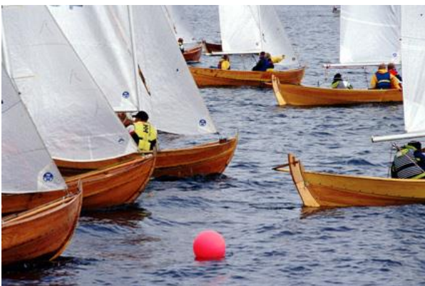
Det tetner til like før start.