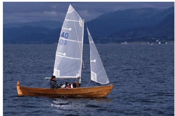
Beste jentebåt under NM : 40 "Blia"