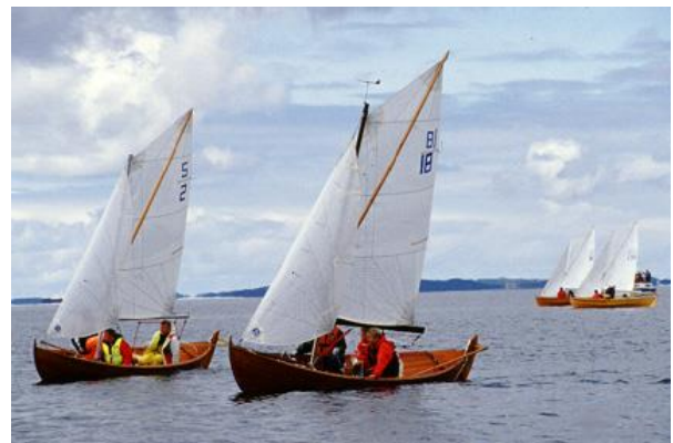
2 "Kryss" og 18 "Berserk" i tett og konsentrert kamp like etter start.