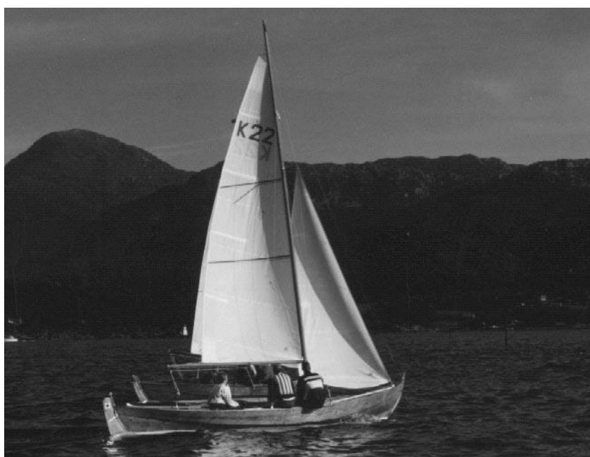
K 22 "Rosita"

*) Lørdag **) Søndag ***) Seilte søndag med 8 kvm L seil og konkurrerte på respitt mot de øvrige K båtene.