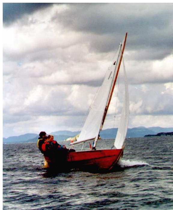
"Seira" i fullt driv ved Tysnes

Spriseil - 8 m 2 : 41 «Seira», Svein Økland, Båtl. Njord/Tysnes 235 poeng.