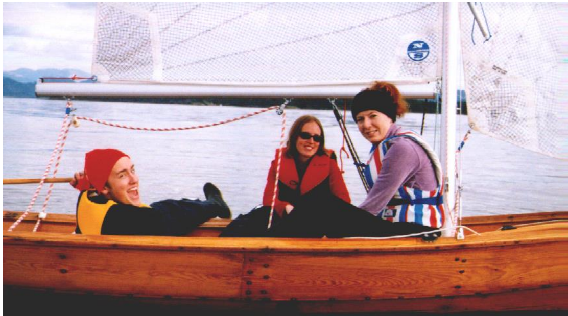
BSI/Seiling har gjort det til tradisjon å dra på 2 helgeturar til Njordstø på Tysnes. Der segla dei Oselvar på utlån frå Båtlaget Njord/Tysnes. Dette biletet er teke hausten 2001.