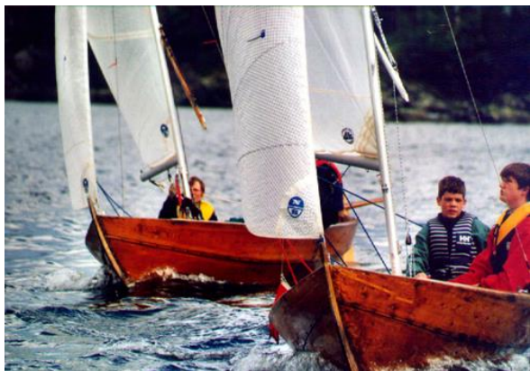
Fra Seglarveka: "Seira" (t.v.) og "Knuppen" i skarp tevling