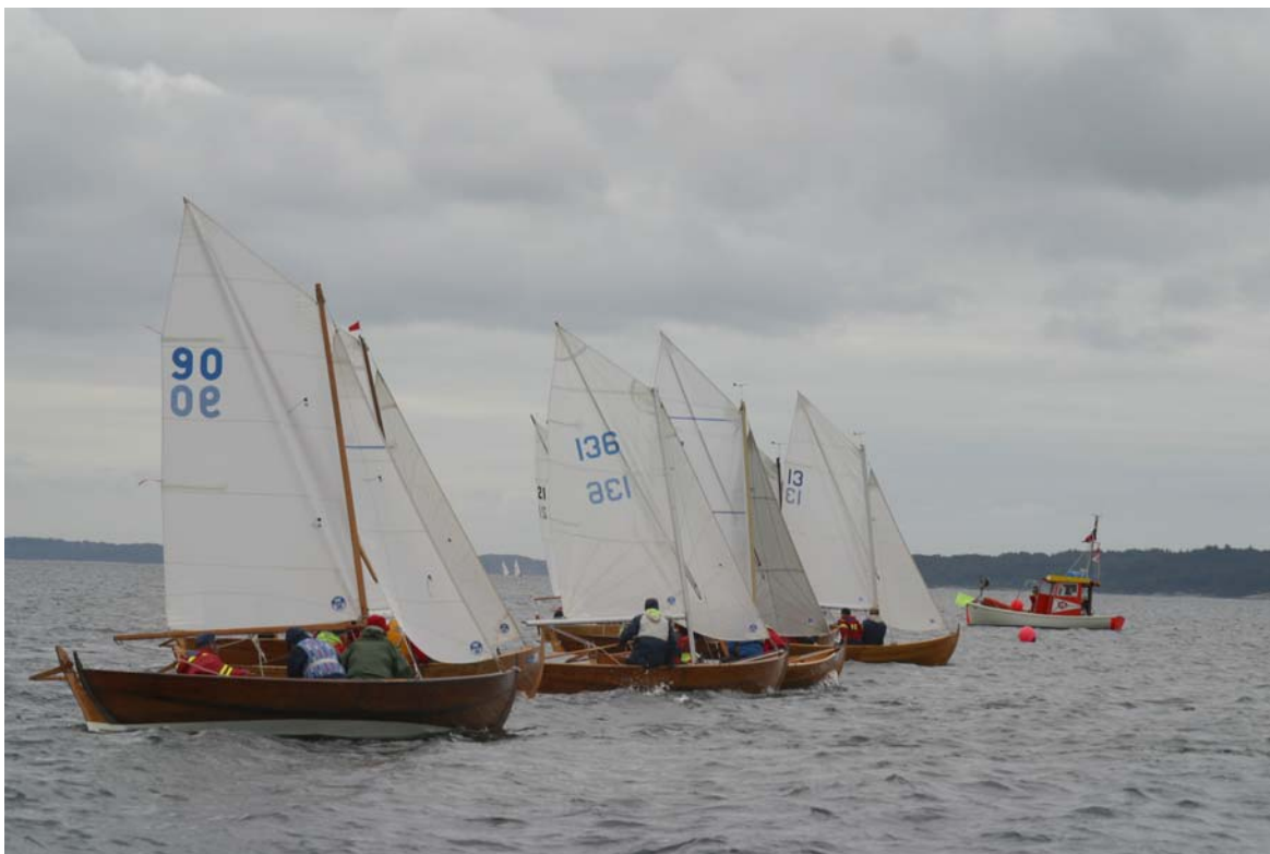
Starten går i 4. NM-seilas.

Dessverre deltok bare 14 spriseilere i NM, slik at oselvarklassen tapte sitt NM status for 2006. Det må derfor seiles nasjonalt klassesesterskap i 2006 med minst 20 deltagende båter for at klassen skal få tilbake gyldig NM status for 2007.