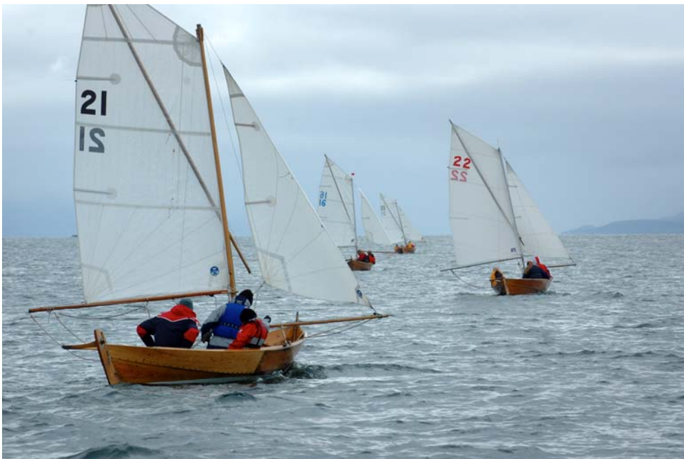
Der fremme er merket! Mildebåter på lens i 4. seilas under Stor-NM 2005.