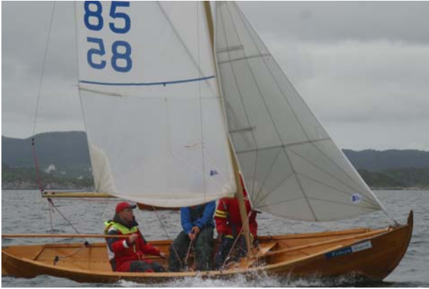
"Hyggen" på kryss under Stor-NM 2005.

Siste dag var vindretningen fremdeles fra nord, bøyene ble koblet på bøyepunktene fra fredag og alt var i god tid klart til lørdagens første seilas. I frisk bris var alle de 14 deltagende båtene på plass ved start en halv time før programfestet startprosedyre. Banesjefen valgte da å heise signalflegg "L", sammen med gjentatte lydssignal, for å få båtene på praiehold. Alle fikk beskjed om å følge med på signaler fra startbåt fordi tid for startprosedyren ville bli fremskutt. Dermed kunne lørdagens første seilas startes 15 minutter foran skjema, noe seilerne var vel fornøyd med.