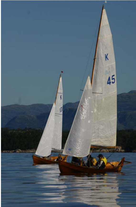
Fra Lerøy Rundt. K45 "Jo" og K101 "Sjanse" kom lengst avgårde i retning Lerøytangen før seilassen ble annullert p.g.a. vindstille.