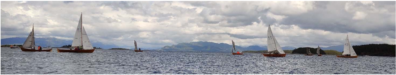
Oselvere i Spriseiklassen og i 10 kvm klasse K er klar til start ved Båtlaget Njord/Tysnes sin Summarregatta i juli 2022.