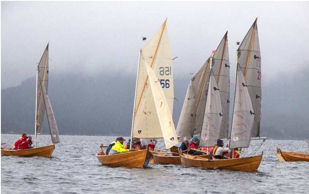
Fra NM Oselvar 2019 på Tysnes.