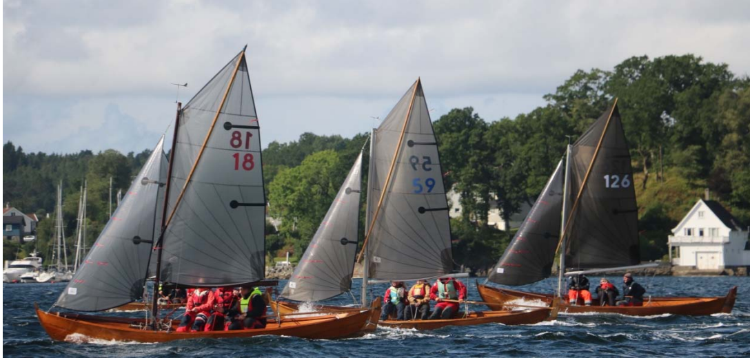
NM Oselvar 2022 på Fanafjorden, i farvannet rett utenfor Mildevågen på søndag 21. august. Hard kniving mellom Tysnesbåtene 18 "Berserk", 59 "Spretten" og 126 "Susi".