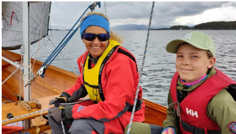
Mannskapet om bord i Tysnesbåten 91 «Stolmaren» er klar til innsats ved Båtlaget Njord/Tysnes sin Summarregatta 2022.